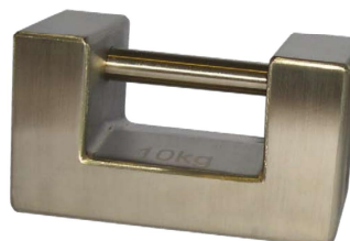
Pesas en acero inoxidable