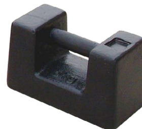
Pesas en acero fundido